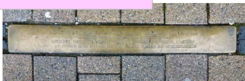
Seesen Stollperschwelle Jacobsonplatz