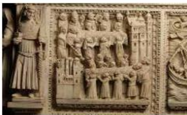
Arche de saint Augustin (1362, basilique San Pietro in Ciel d'Oro, Pavie). Détail du panneau représentant l'arrivée du corps d'Augustin à Pavie et son entrée dans San Pietro in Ciel d'Oro avec le roi Liutprand

Cette riche histoire et ses splendides productions diverses seront l'objet de notre conférence du 10 avril, en préparation du voyage de l'ACFA sur les traces des Lombards. »