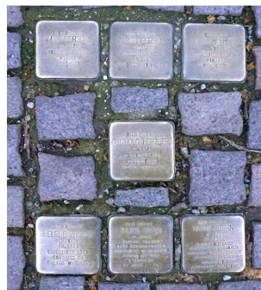
Seesen Pierres de Trébuché Jacobsonstraße Jacobsonplatz