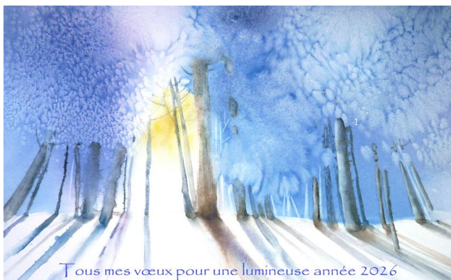
Tous mes vœux pour une lumineuse année 2026 Peinture de Marie Christine MOULY

Finalisation de la journée 31 janvier 2026 à Sorgues Le projet du Comité des jumelages de Sorgues étape d'un échange scolaire le Dimanche 22 Mars 2026 Le projet du Comité des jumelages de Sarrians Soirée Cabaret le samedi 28 Mars 2026 Le projet du Comité des jumelages d'Althen des Paluds "Imaginer l'Europe" mai 2026, mars 2027